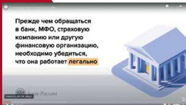
Видеоинструкция «Как проверить финансовую организацию»